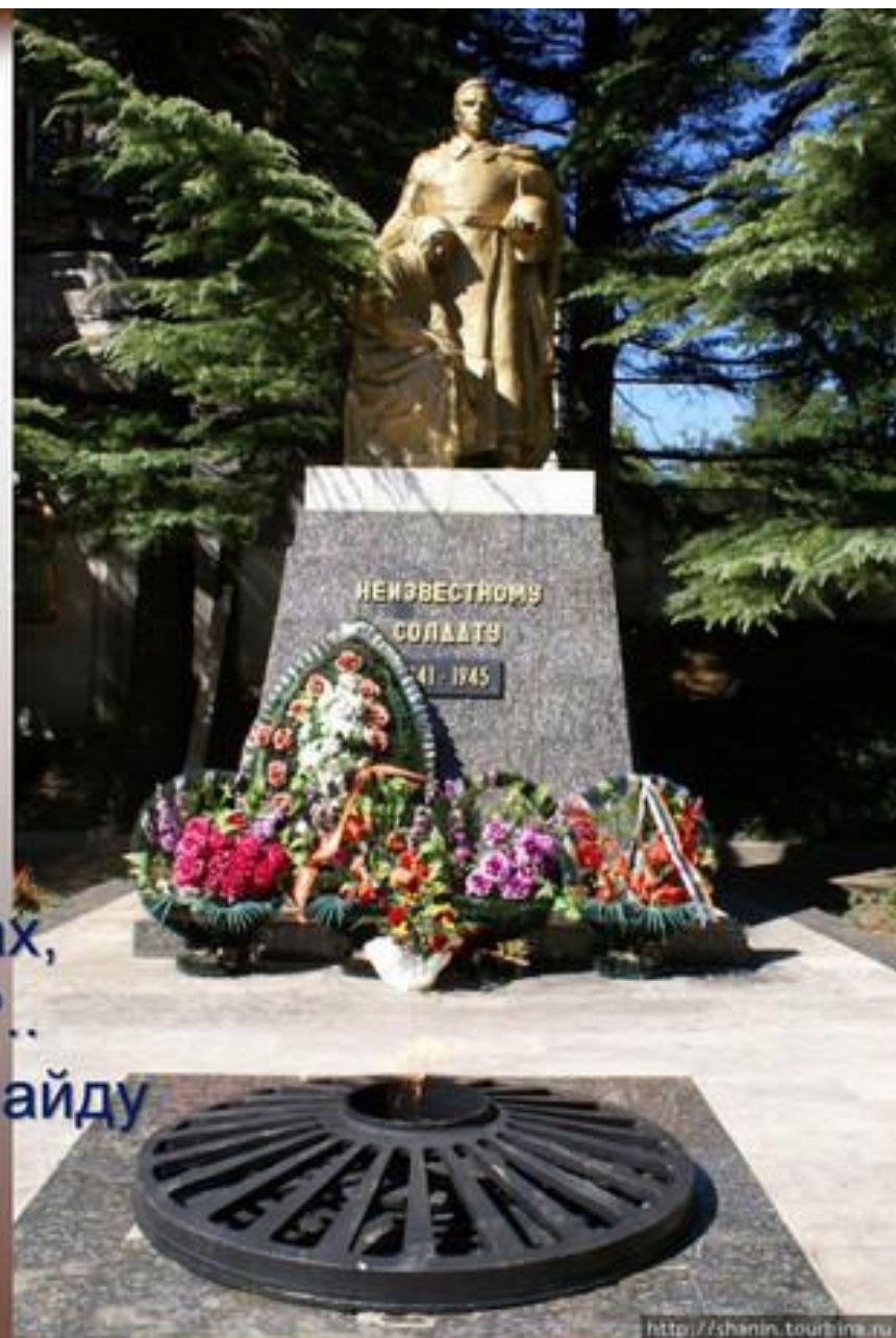
Памятник в Туапсе