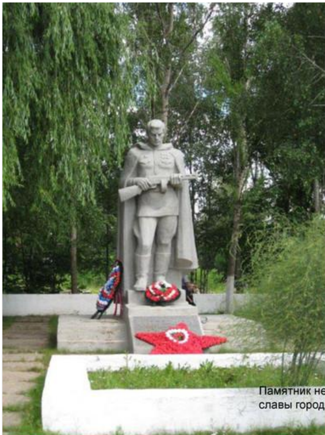
Памятник неизвестному солдату на кургане славы города Алексина Тульской области