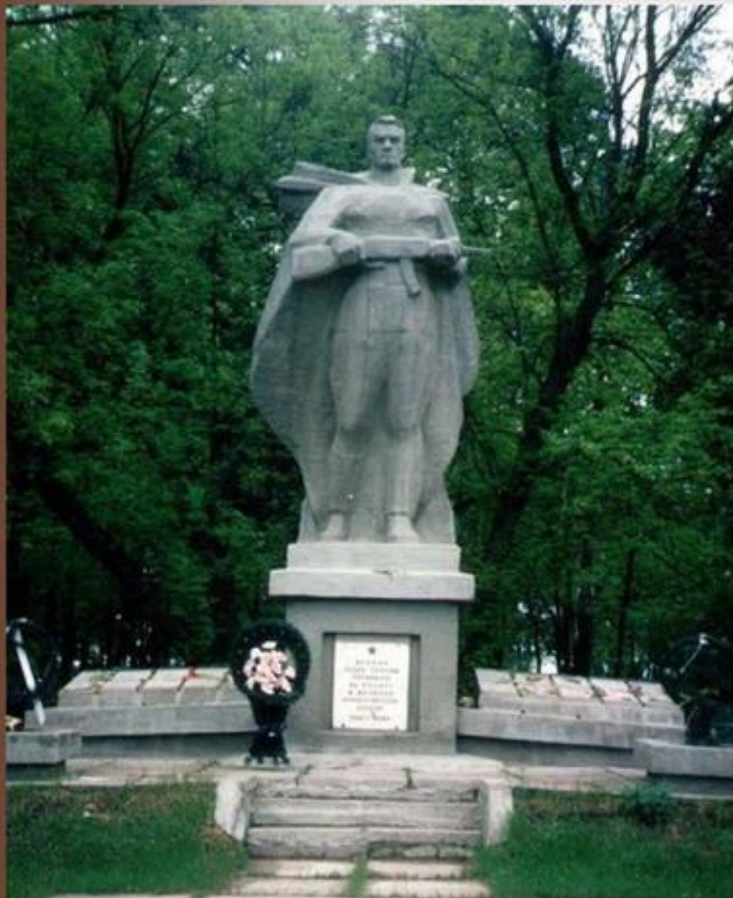
Памятник в Рогачеве