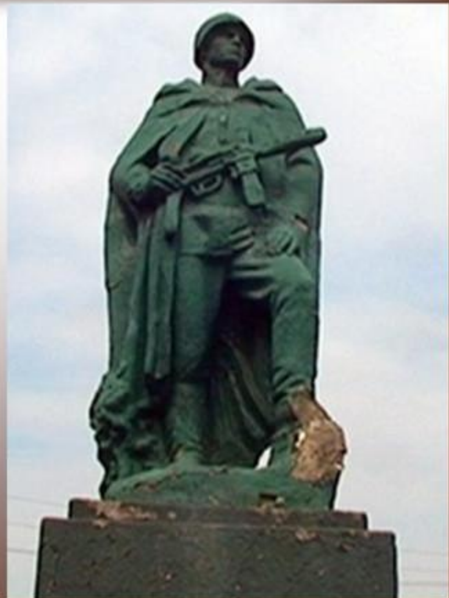
Памятник в Новокузнецке