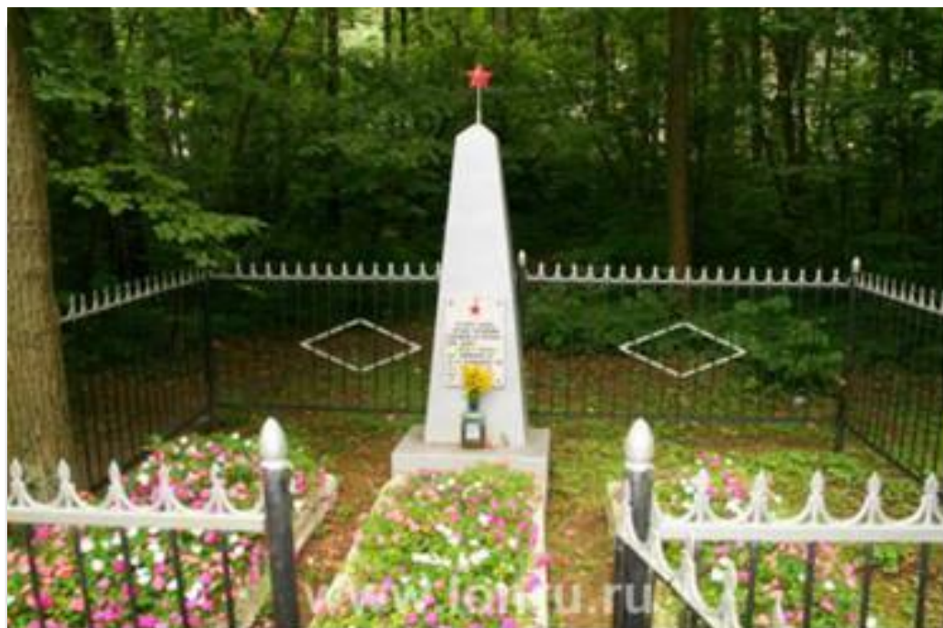
Жуковка - могила неизвестному солдату , погибшему во время Великой Отечественной войны