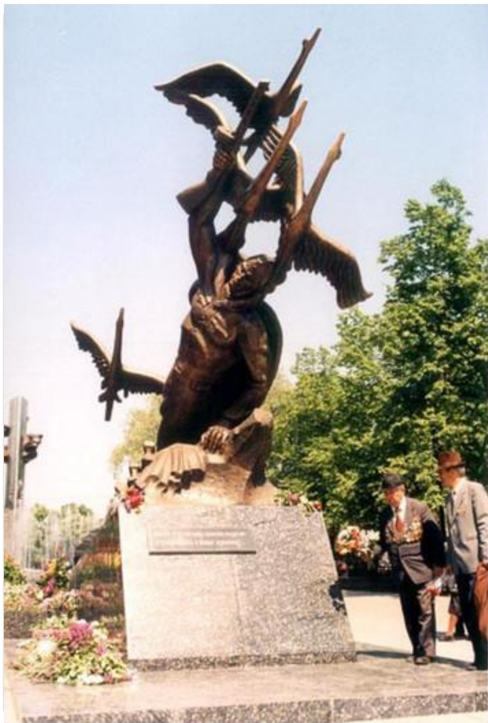
Мемориальный комплекс Героям Великой Отечественной войны, памятник Неизвестному солдату. Луганск