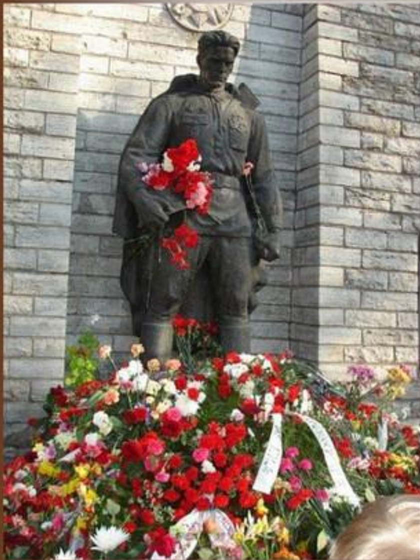
Памятник неизвестному солдату в Таллинне (до апрельских событий)